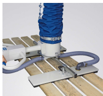
Duplafejes megfogó FM